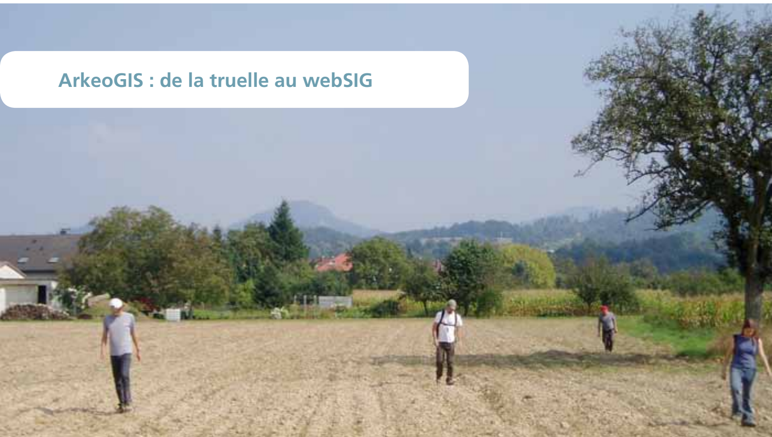
Prospections pédestres au pied du Battert (Baden-Baden)

L'archéologie moderne est une discipline en pleine évolution, les outils numériques font partie intégrante de ce changement d'habitudes de travail : ils nous permettent de gagner un temps précieux, de capitaliser les travaux de nos prédécesseurs et de développer de nouvelles approches.