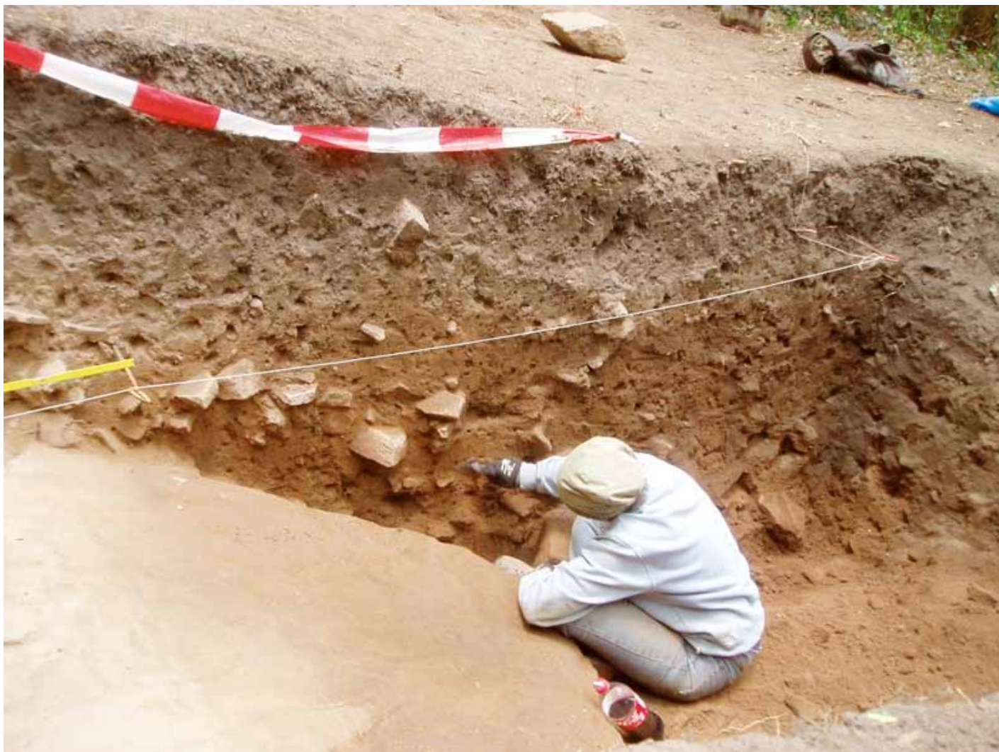
Vue de la fouille de Neuenburg et de la stratigraphie d'érosion et d'occupation du site

L'outil se révèle aussi très riche pour la production de synthèses régionales transfrontalières et de cartes « exhaustives ». En tout cas, c'est certainement actuellement le meilleur outil pour tendre vers cet état de la recherche ! Les cartes qui seront produites après intégration des bases disponibles dans la vallée