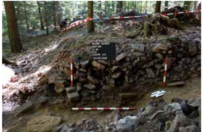
Vue de la coupe du rempart protohistorique de Baden-Baden et détail du substrat rocheux © S. Gentner, UdS.

L'effet d'entraînement est important : plus le nombre de sites augmente, plus les chercheurs mettent leurs données à disposition. Gageons que cet effet permettra le développement et l'utilisation d'autres outils libres en ligne qu'il reste à connecter au projet. Espérons aussi que les bénéfices évidents qu'apportent à la recherche ces transformations dans les pratiques de travail feront disparaître les appréhensions des chercheurs en sciences humaines.