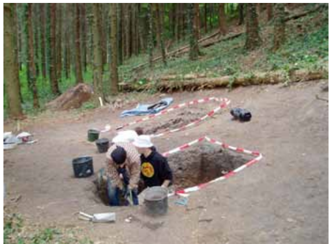
Vue du chantier de Neubeurg